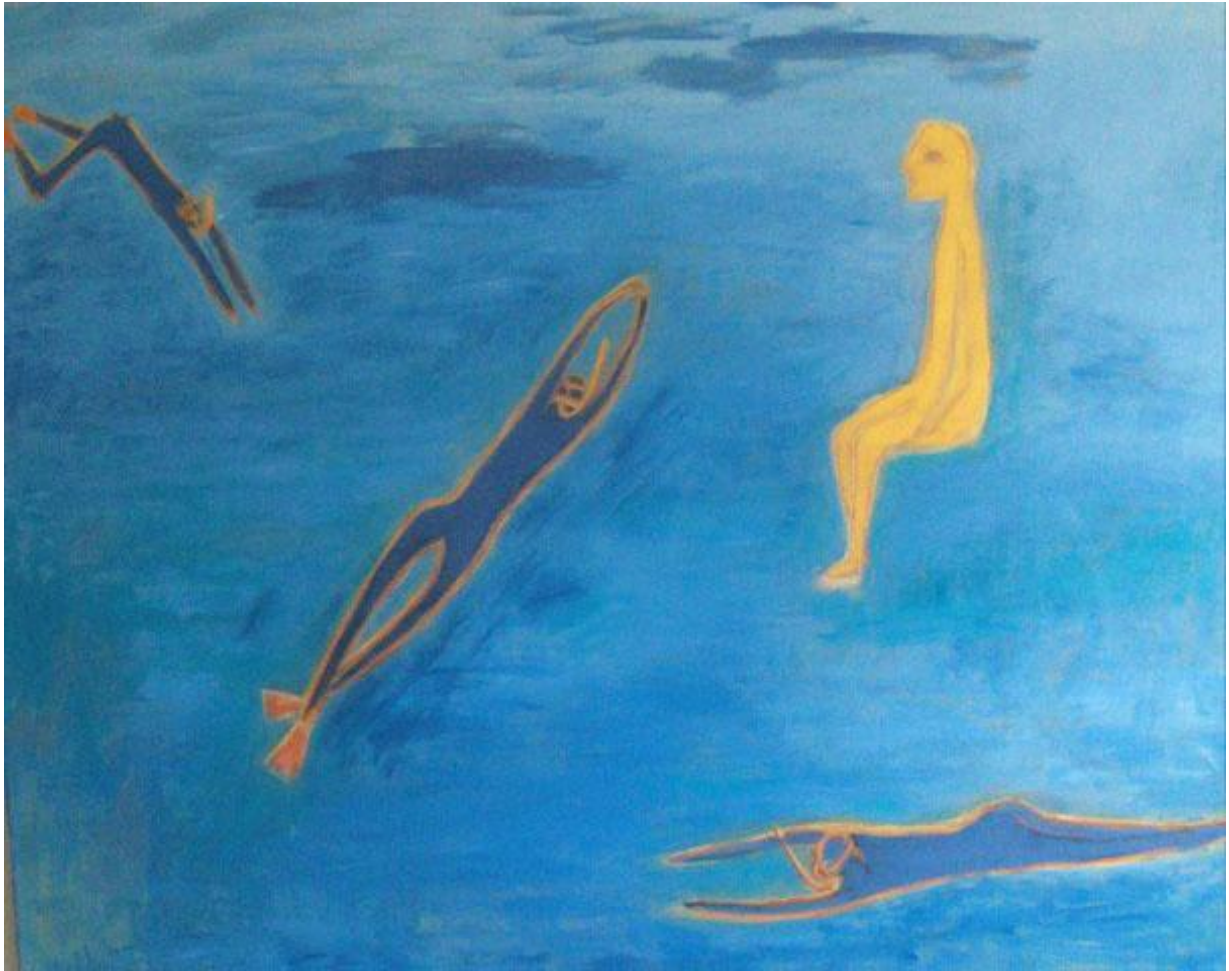
Aggi Folgerø Johannessen: "Betrakteren", akryl/lerret.

Pressemelding: To separatutstillinger på Risøbank: